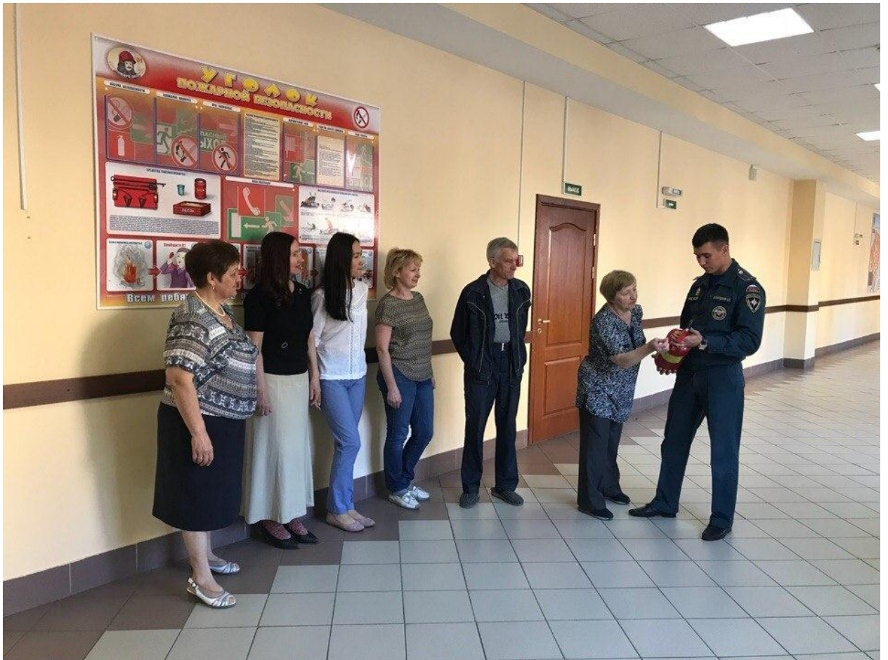
ОНДПР Центрального района 29.05.2018г.